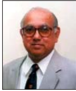
秘书长 萨特亚·南丹

管理局工作人员负责执行大会和理事会指定的日常任务。秘书处现有37人的核定编制（2003-04年）。自成立以来，萨特亚·南丹一直担任秘书长，其第二个四年任期到2004年结束。