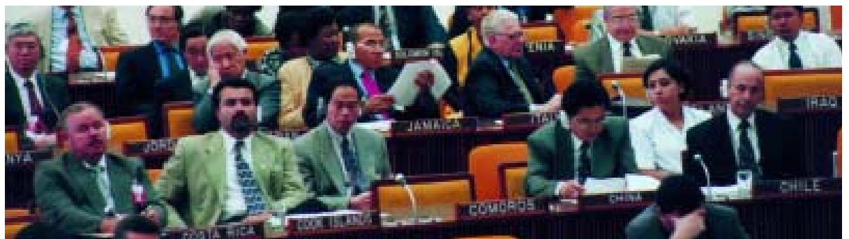
国际海底管理局某届会议现场

管理局采用召开 年会 的方式开展工作，期间所有机构均举行会议，一般为期两周。这些会议通常于7、8月间在牙买加金斯敦的管理局总部举行。