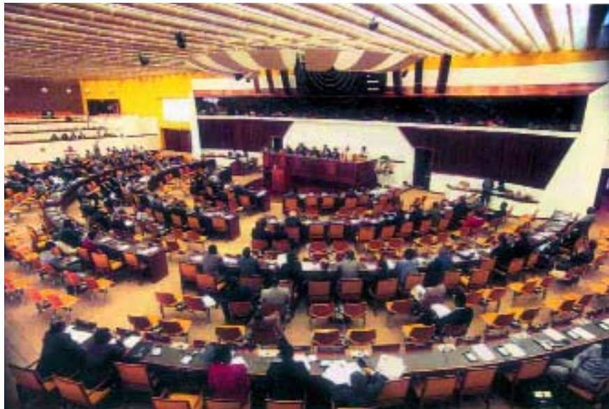
国际海底管理局成立仪式-牙买加金斯敦

《海洋法公约》规定，涉及第十一部分的海底问题的法律争端应由国际海洋法法庭所设的海底争端分庭处理。遇不遵守的情况，仅可由理事会代表管理局向分庭提起诉讼。