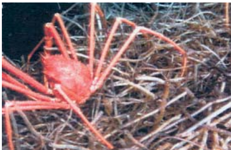
Organismes et faune des grands fonds à proximité d'évents hydrothermaux

Au cours des ateliers organisés par l'Autorité internationale des fonds marins, l'accent est de plus en plus souvent mis sur le fait que les ingénieurs doivent davantage se préoccuper des conséquences environnementales que peuvent avoir les équipements d'extraction minière des fonds marins qu'ils conçoivent. Afin de respecter les normes environnementales établies par l'Autorité, les exploitants des gisements sous-marins devront faire en sorte que leurs opérations causent le moins de perturbations possible, car les nuages de sédiments soulevés par les appareils de ramassage et de forage engoutissent les animaux qui se trouvent sur leur passage ou dans leur voisinage immédiat, et modifient les caractéristiques chimiques des eaux ambiantes. Aussi s'efforcera-t-on de réduire la quantité de sédiments soulevés lors du ramassage de nodules, non seulement pour préserver l'environnement mais aussi parce que les sédiments, qui sont des déchets, diluent la proportion de métaux dans le produit à traiter. En outre, des études seront effectuées afin de déterminer la profondeur à laquelle les sédiments, qui seront inévitablement ramassés en même temps que les nodules, pourront être évacués. Cette opération pourrait se dérouler soit à la surface de l'eau soit à quelque niveau intermédiaire où elle serait le moins nuisible pour le milieu.