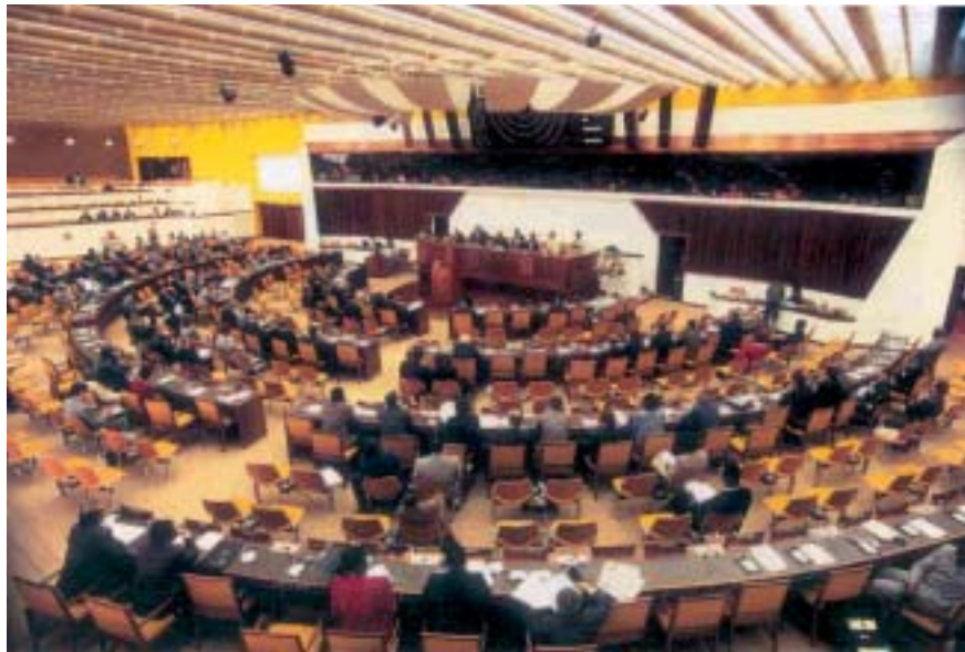
Inauguration de l'Autorité, à Kingston (Jamaïque)

Aux termes de la Convention sur le droit de la mer, les différends juridiques relatifs aux fonds marins visés dans la partie XI sont arbitrés par la Chambre pour le règlement des différends créée par le Tribunal international du droit de la mer. Le Conseil est seul habilité à la saisir, au nom de l'Autorité, dans les cas d'inobservation.