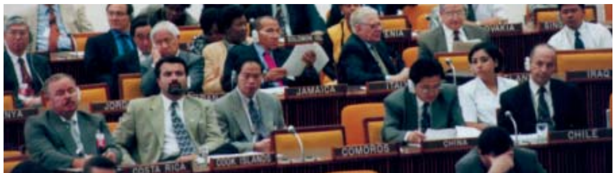
Réunion d'une conférence de l'Autorité

L'Autorité tient habituellement des sessions annuelles d'une durée de deux semaines pendant lesquelles tous ses organes se réunissent à son siège, à Kingston (Jamaïque), généralement en juillet ou en août.