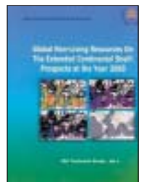
Quelques publications de l'Autorité internationale des fonds marins