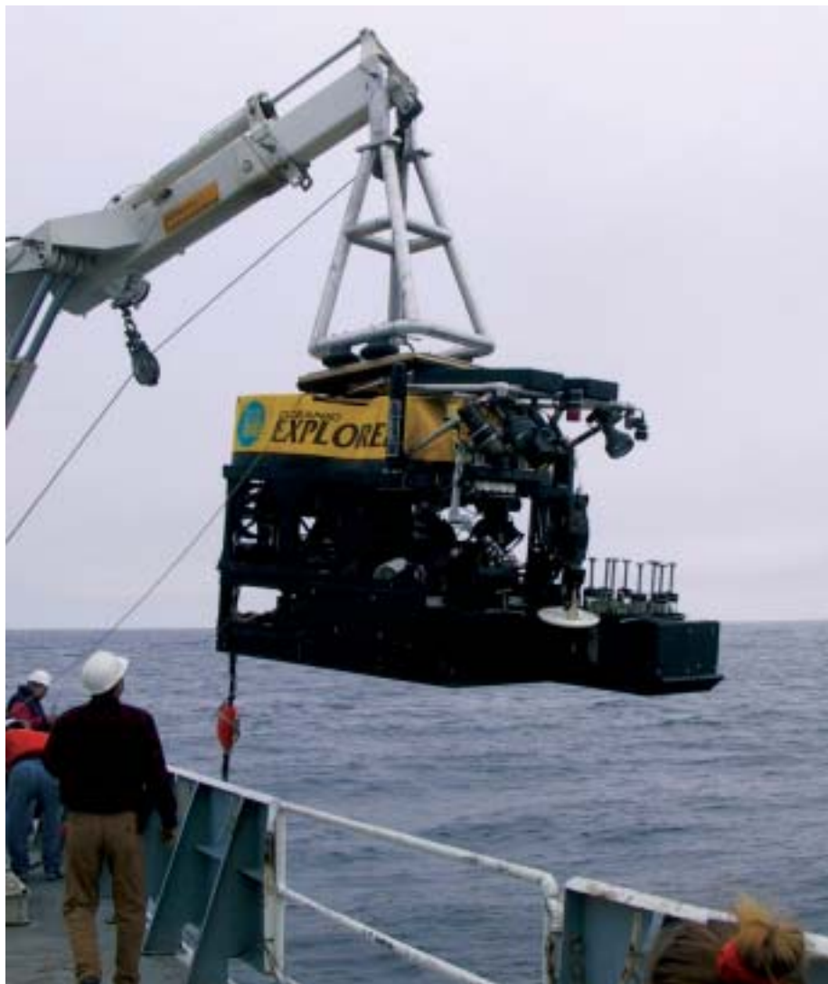
Дистанционно управляемые подводные аппараты позволяют ученым осуществлять пробоотбор в недоступных местах (Западное Побережье NURP)

Дистанционное зондирование должно дополняться непосредственным изучением проб, доставленных на исследовательское судно и нередко анализируемых в лабораториях на берегу. Ковшовые, грейферные и контейнерные пробоотборники опускаются на морское дно для получения биологических и геологических образцов с поверхности морского дна и из находящегося непосредственно над ней водного слоя, а также из подповерхностного слоя. Эти устройства должны быть сконструированы и эксплуатироваться таким образом, чтобы доставлять на поверхность неповрежденные образцы фауны. Более глубоководный пробоотбор можно производить с помощью конусов, трубок или бурения. На сегодняшний день еще не разработаны устройства, которые позволяли бы бурить на 50-100 метров в глубину породы и которые, несомненно, понадобятся геологам для изучения таких залежей, как метилгидраты – колоссальные бассейны замороженного природного газа. Биологическим исследованиям, и в особенности опознаванию видов, в последнее десятилетие в значительной степени способствовало развитие генетического анализа, который позволяет ученым определять и сопоставлять образцы во много раз быстрее, нежели когда им приходилось полагаться на тщательный осмотр каждой пробы под микроскопом.