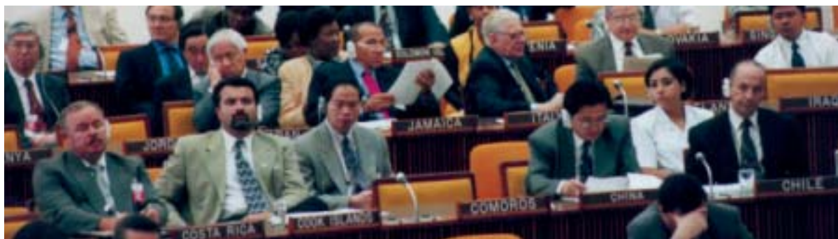
Конференция Органа на сессии

Следуя заведенному порядку, Орган собирается на ежегодные сессии , во время которых все его органы обычно заседают по две недели. Эти заседания проводятся в штаб-квартире Органа в Кингстоне (Ямайка), обычно в июле или августе.