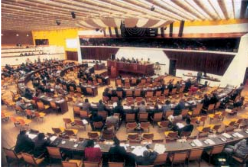
Торжественное открытие Органа – Кингстон, Ямайка

Согласно Конвенции по морскому праву, юридические споры по вопросам морского дна, подпадающим под часть XI, должны разбираться Камерой по спорам, касающимся морского дна, которая учреждается Международным трибуналом по морскому праву. Возбудить разбирательство в Камере может только Совет от имени Органа в случаях, когда идет речь о несоблюдении обязательств.