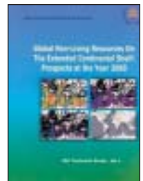
Некоторые публикации Международного органа по морскому дну